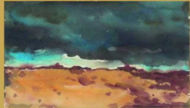
III تقاسيم الليل والنهار